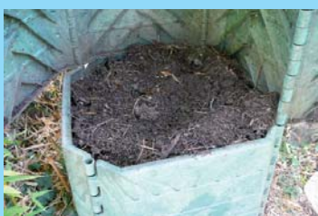
Ibarreko boluntario batek lortutako konpostaren argazkiak