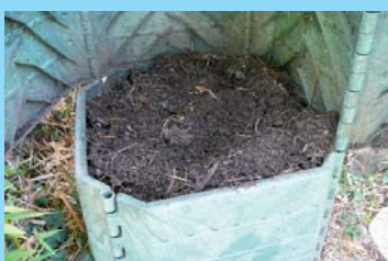
Fotos del compost obtenido por un voluntario del Valle