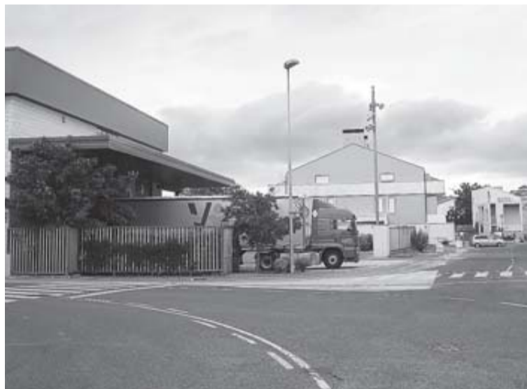
Vista de la zona industrial de Mutilva.