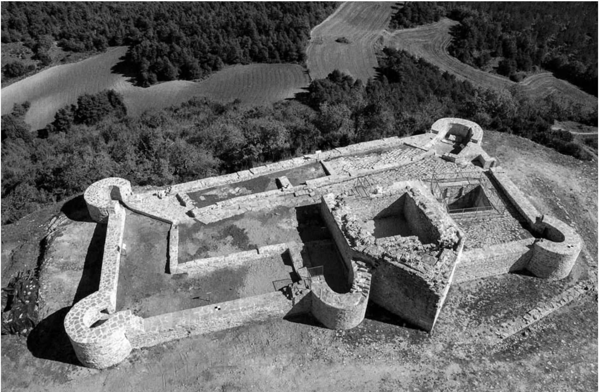
Vista aérea de los restos del castillo, situado en la cima del monte Irulegi.