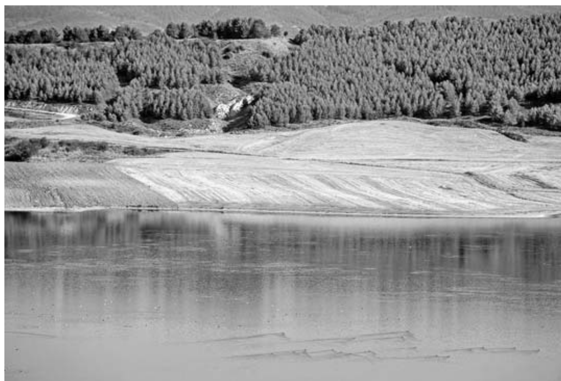
Vista de archivo de la balsa de Zolina-Ezkoritz, entre Zolina y Badostáin.

También todos estuvieron de acuerdo en sentar las nuevas bases para el reparto de 24.000 euros entre colectivos locales para contribuir a mejorar las condiciones en países en vías de desarrollo. Igualmente se dio el visto bueno a la plantilla orgánica de 2020, aunque aquí EH Bildu se abstuvo para, dijo su portavoz Berta Arizkun, recordar que habrá que negociar un presupuesto y que debían convocarse las plazas de la oferta pública de empleo.