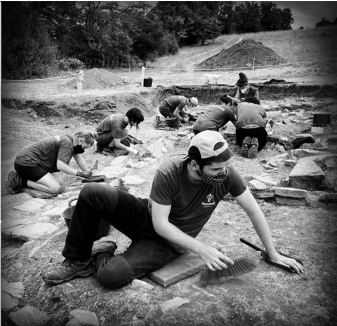
Arqueólogos voluntarios de Aranzadi y universitarios en prácticas realizan el trabajo sobre el terreno. JESÚS CASO