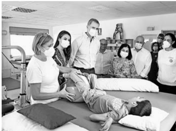
Los Reyes visitaron primero el centro de Aspace en Cizur Menor.