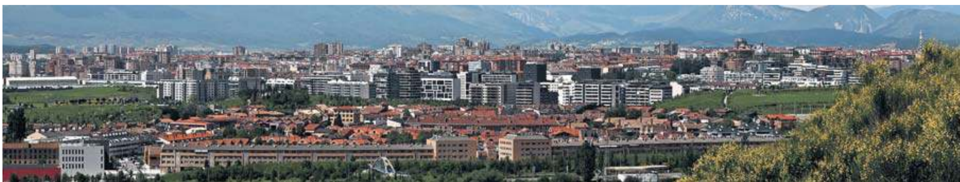
Vista de Mutilva (en primera línea y cabecera del Valle de Aranguren) y Pamplona, tomada desde Badostáin.