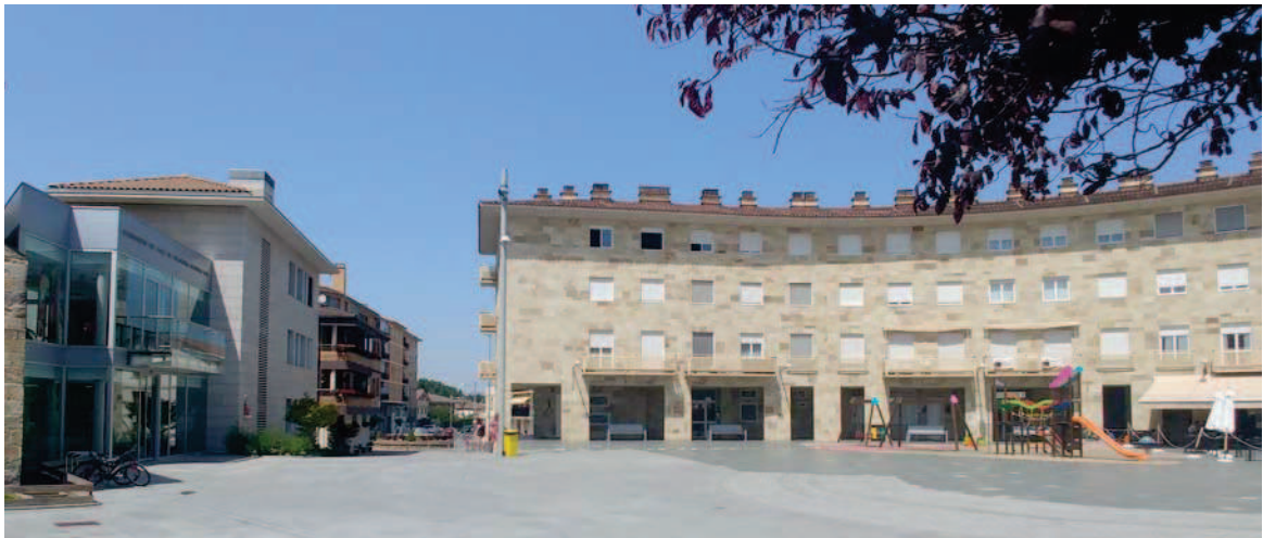
La plaza Mutiloa, parcialmente urbanizada

Se diseña una zona específica para la reubicación de los contenedores de recogida de residuos urbanos, como remate de la zona verde ampliada al sur del frontón.