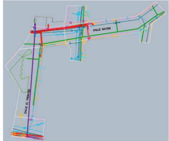
Esquema de las infraestructuras actuales del ámbito PCCS

No se prevé actuar sobre la red de gas natural.