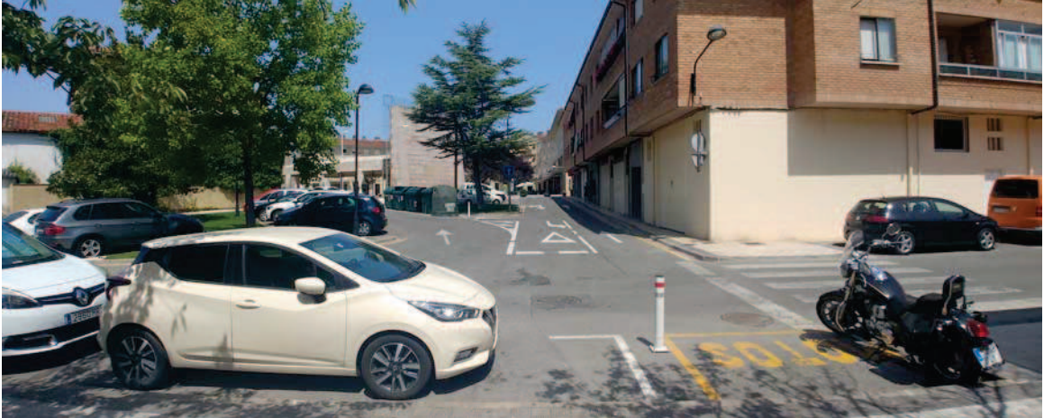
Vista de la calle del Frontón, desde la avenida del Sadar hacia la plaza Mutilloa

Dentro del ámbito se hayan actualmente algunos árboles, los cuales se pretende mantener prácticamente en su totalidad: un abeto de gran porte en el parterre que acompaña a los aparcamientos de la calle del Frontón; un falso plátano y una higuera en uno de los parterres del ámbito sur.