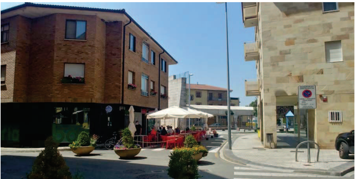
Vista de la calle Mayor, desde la calle La Cruz hacia la plaza Mutiloa

Por otra parte, la calle Mayor es un vial que se ha peatonalizado provisionalmente pero que mantiene sus características de antiguo vial rodado, en su trazado, materiales, iluminación, etc., aunque con la actuación de la primera fase, se eliminó el desnivel existente con la plaza Mutiloa que no permitía la continuidad peatonal y visual con la misma.