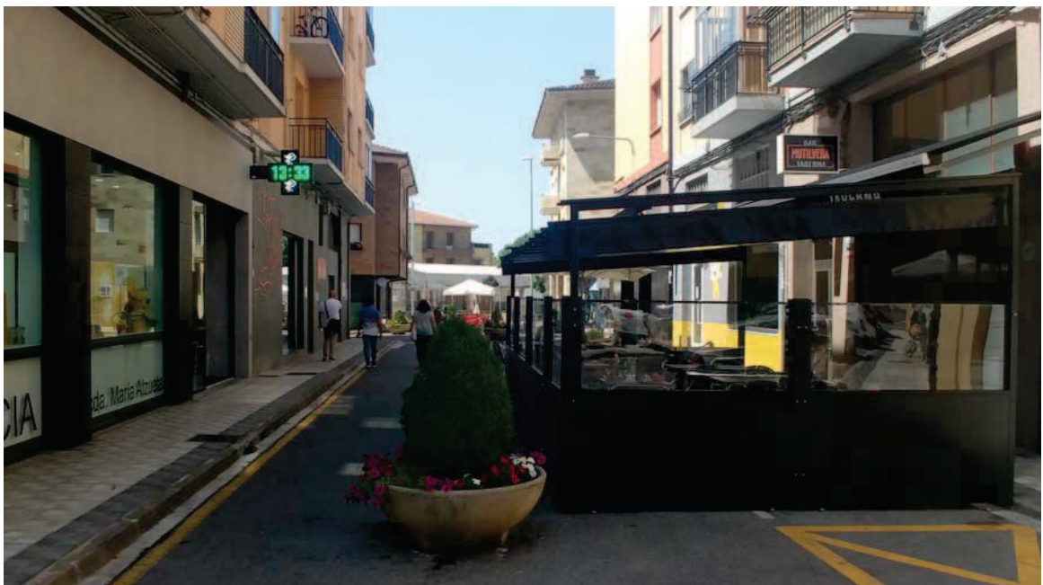
Vista de la calle Mayor, entre las calles La Cruz y Nueva

La peatonalización de la calle del Frontón y de la primera parte de la calle Mayor, desde la plaza Mutiloa hasta la calle Nueva, es el requerimiento principal de la propuesta. Desde hace varios meses la calle Mayor está cortada al tráfico rodado, de forma provisional y para dar cabida a las terrazas exteriores de los servicios de hostelería de la calle, en el citado tramo. La conexión peatonal de la plaza Mutiloa con el paso sobre el río existente más allá de la avenida del Sadar y con el paseo Ibaialde era uno de los objetivos originales del concurso la urbanización del entorno de la Plaza Mutiloa y el entorno del ayuntamiento. La presente propuesta da cumplimiento a estas demandas.