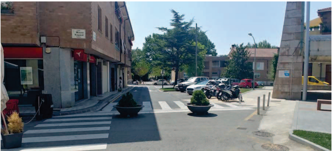
Vista de la calle del Frontón hacia la avenida del Sadar

En este sentido la calle del Frontón sigue siendo un ámbito principalmente rodado, no tiene una configuración clara y el elemento singular que le da nombre, el frontón, sigue estando parcialmente rodeado de viales y aparcamientos de vehículos.