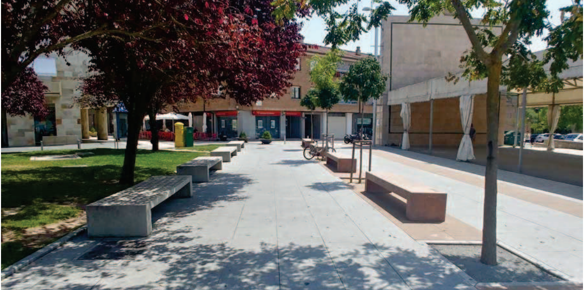
Vista desde la plaza Mutiloa hacia las calles Mayor y del Frontón

Del mismo modo que con los pavimentos, con el mobiliario urbano propuesto se ha seguido el criterio de tomar como referencia el utilizado en la primera fase de la urbanización de la plaza: