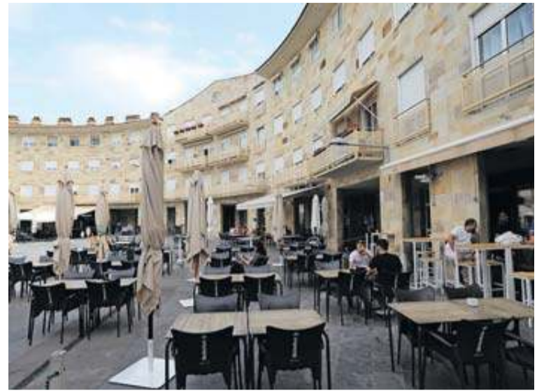
Imagen de archivo de la plaza Mutiloa de Mutilva.

El documento fija en 16 el máximo de mesas y 64 el de sillas si las dimensiones del espacio lo permiten. Se refiere también a la densidad, con mesas de un máximo de 0,80 metros por 1,60 y 4 sillas, con cuatro personas por cuatro me-