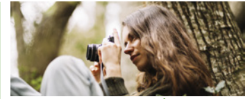
CONCURSO DE FOTOGRAFÍA AMBIENTAL VALLE DE ARANGUREN 2024