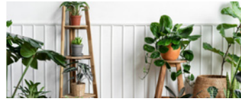
DÍA INTERNACIONAL DE LA FASCINACIÓN POR LAS PLANTAS