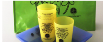
VUELVEN LOS KITS SOSTENIBLES