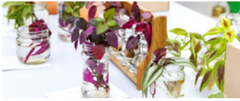
INTERCAMBIO DE ESQUEJES