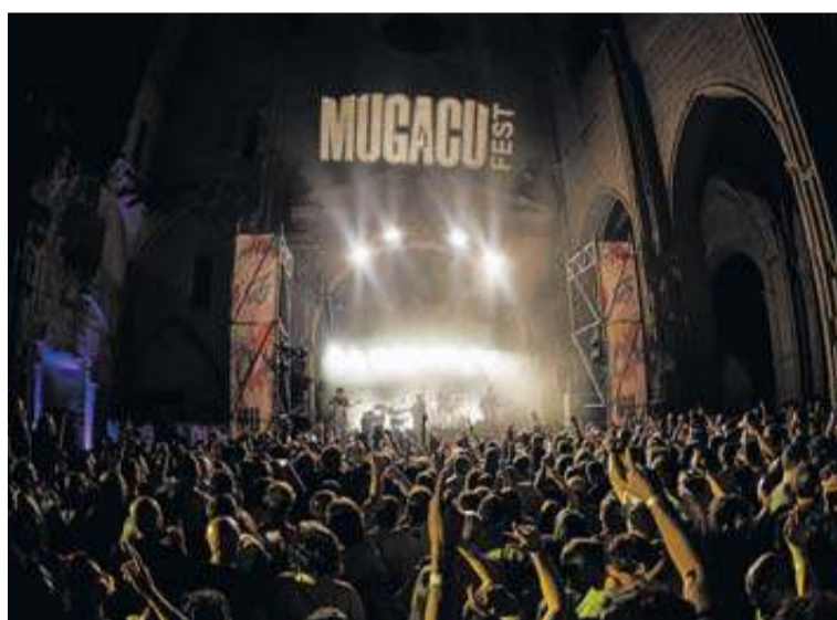
Uno de los conciertos del Mugacu Fest de este año.

visitas guiadas al público general de la mano de arqueólogas que trabajan en el yacimiento. Estarán abiertas hasta el 29 de septiembre, de miércoles a domingo, comenzando a las 10.00 desde el parking de Ilundain. Este año, además, las visitas están disponibles también para centros escolares que deseen realizar una excursión con su alumnado. Las visitas guiadas se pueden reservar a través de www.irulegi.eus .