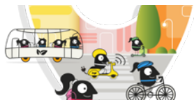
MUGIKORTASUNAREN EUROPAKO ASTEA